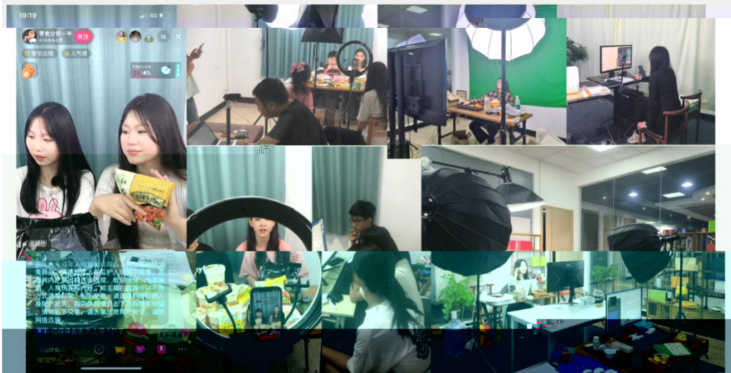
部份学员在进行电商直播实训现场