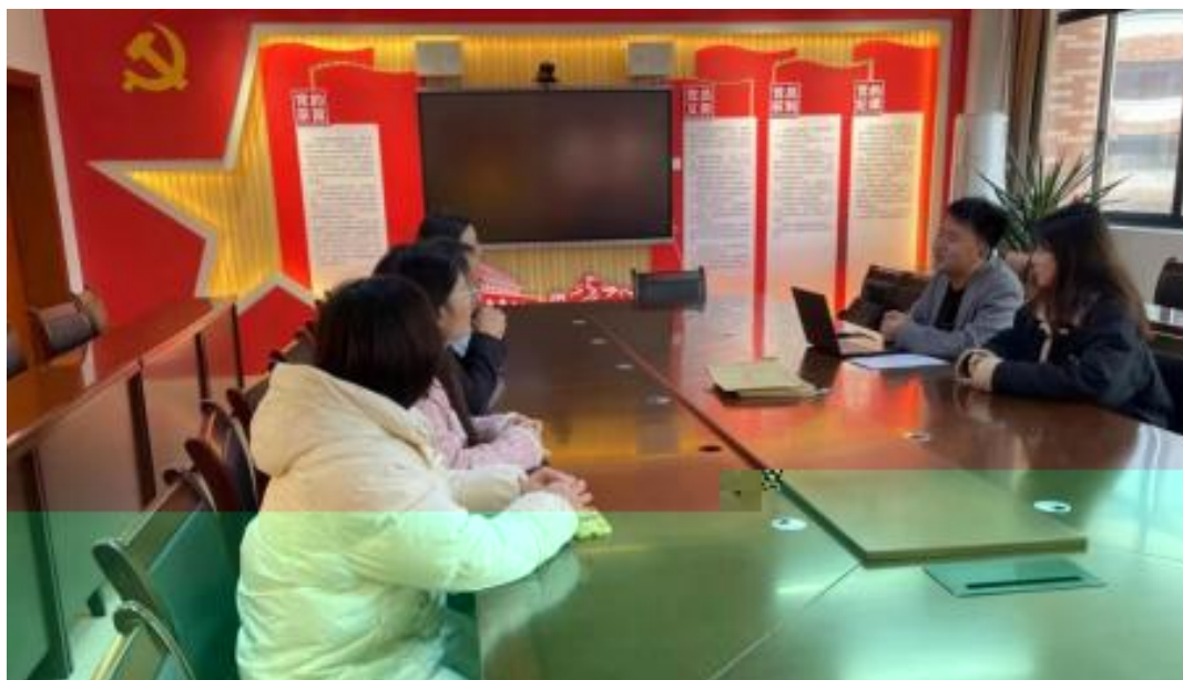
图 校企开展学术研讨项目交流会议

1 公 高度 队的 ，充分 到 和 的关 ，对 高 和 关 的 。此公 供 ，包 更 、 方法 及 导 发 程，并 持 丰富 的 家 过 、 会和 际案 ， 队 分 的 和 。 常 地 活动， 包 参加 会 、 等 ， 促 的 的 分 ， ， 并 的 队 ( 1)。