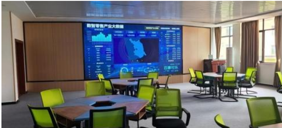
图 智慧零售运营中心

智慧零售运营中心 319 积 130 方集大分、和创 创 孵化 的 慧 ( 2-3), 包 含 备、 及 等 90.01 ( 表 1)。